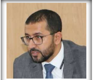
السيد حسن صاخي النائب الثالث للرئيس