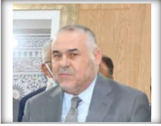
السيد حسان بركاتي النائب الثاني للرئيس