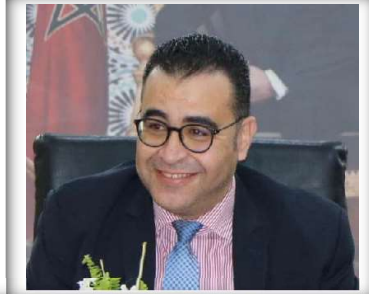
السيد الحسين عليوي رئيس جامعة الغرف المغربية للتجارة والصناعة والخدمات