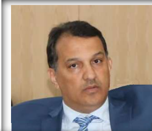
سيدي خليل ولد الرشيد نائب الرئيس، المقرر